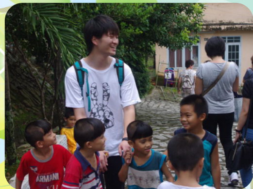
スタディーツアーにて子どもたちと交流