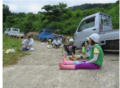
地域の方との交流