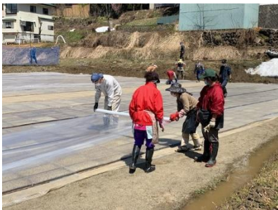
育苗箱の運搬、敷設作業