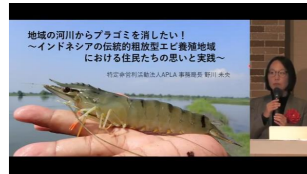
第9回環境シンポジウム 活動を通じて感じたゴミ問題を語る 助成者：野川未央氏(特非) APLA事務局長