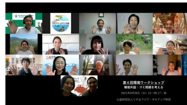
第4回環境ワークショップ テーマ：ゴミ問題を考える 助成者との共話 (国内及び海外13地域と繋がりました)