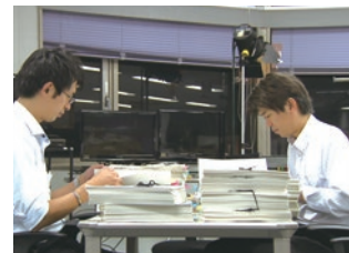
株式会社チューリップテレビ(富山県)

「政策立案等に関するガイドライン」を策定し常任委員会ベースの議会活動を推進。「議決・決議」という従来の権限と「政策提言」という政策をつくり議決まで持っていくことを実現。