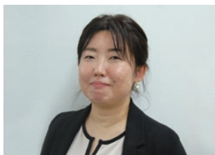
多胎育児のサポートを考える会(東京都千代田区)

富山市議会を4年にわたって集中的に取材。「議員報酬の引き上げ」取材を皮切りに、後に14人の市議が辞職する「政務活動費の不正」の調査報道に繋がりました。