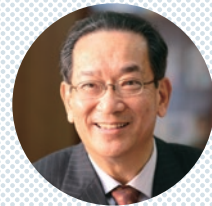
審査委員長 北川正恭

マニフェスト大賞は、地方自治体の議会・首長等や地域主権を支える市民等の、優れた活動を募集し、表彰するものです。これにより、地方創生を推進する方々に荣誉を与え、さらなる意欲向上を期するとともに、優れた取り組みが広く知られ、互いに競うようにまちづくりを進める「善政競争」の輪を拡げるために設けられました。政策本位の政治、生活者起点の政策を推進するために、ご注目頂くとともに、奮ってのご応募をお待ちしています。