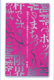
▲著書「モテるまちづくりーまちづくりに疲れた人へ。」と「純粹でポップな限界のまちづくりーモテるまちづくり2」