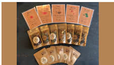
農園 CuRA! @farm_cura