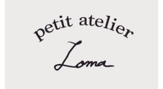
Loma (ロマ) @petit.atelier_loma