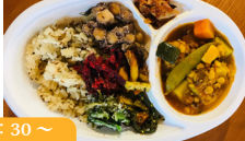
*販売 11:30 ~ (無くなり次第終了) 七つ森 @nanathumori_0326