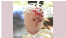
ラ・ファミーユスユクル @kaimanonsho