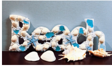
head salon lotus @head_salon_lotus