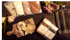
大人の泥遊び! クレイセラピー体験 @u.ogurin