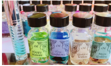
amical® bodycare&メモリーオイル @chanyumi.2.9