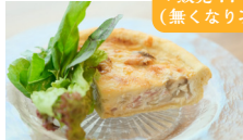
デザミ・アンティム