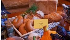
Pain pour ・ぱんぷー @pain.pour