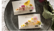
anoano accessoires @anoano.accessoires